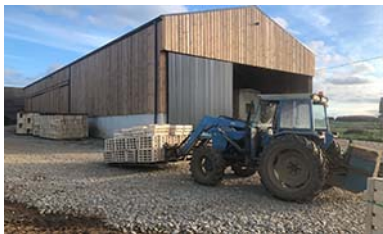
Der Hof liegt in Carantec an der Nordküste der Bretagne.