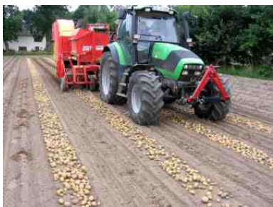
Der Sammelroder beim Aufnehmen der sauberen und trockenen Kartoffeln