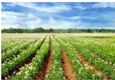
Kartoffelanbau in der Lüneburger Heide auf den leichten, anlehmigen Böden