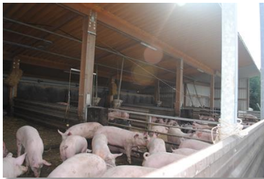
Schweine im Offenstall auf dem Schweinemast-Betrieb von Dominik Greim