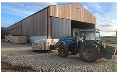
Der Hof liegt in Carantec an der Nordküste der Bretagne.