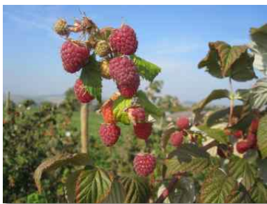
Himbeerfeld im schönen Heckengäu