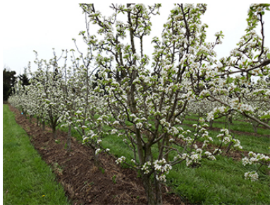
Unter der Sonne der Provence reifen die Birnen auf 8 Hektar heran. Hühner halten schädliche Insekten von den Bäumen fern.