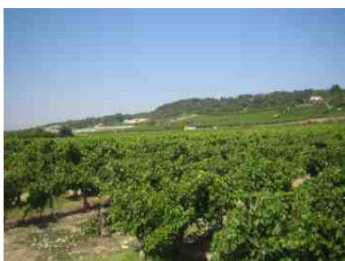
Ihr Betrieb befindet sich seit 1985 am Ortsrand von Bellegarde, angrenzend an Obstbaumplantagen und Weinbergen.