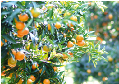
Clementinen: süß, saftig und meistens kernlos.