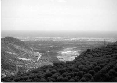
Die Sybaris-Ebene: fruchtbar & schön.