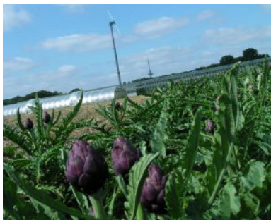
Artischocken im Freilandanbau des Biohofes Borghoff.