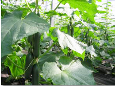
Im Freiland wie auch unter Glas wachsen die Pflanzen auf gesundem, nährstoffreichem Boden.