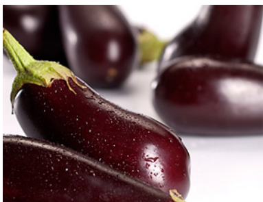
Hier gibt es frisches, exotisches Gemüse in Bio-Qualität aus Deutschland.