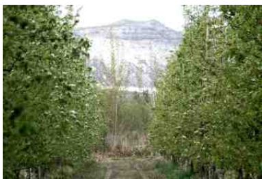
Idyllische Lage im fruchtbaren Tal des Rio Negro.