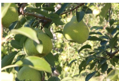
Viele Sonnenstunden garantieren die besondere Qualität.