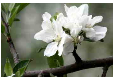
Erste Birnenblüten unserer Früchte.