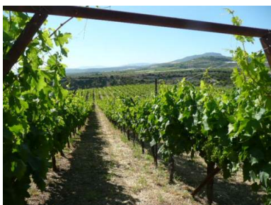
Die 8 Hektar große Traubenplantage.