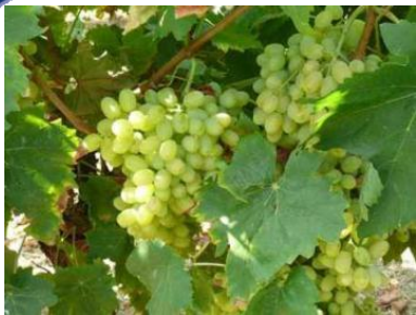
Aromatische Sultanas Trauben, weiß und kernlos.