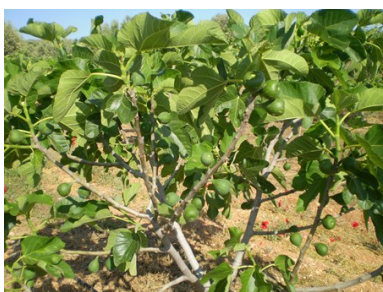
Der Feigenbaum trägt grüne Früchte.