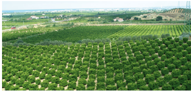
Die Sybaris-Ebene: fruchtbar & schön