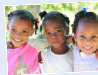
Rund 100 Kinder besuchen den Kindergarten und die Grundschule.

Der Kindergarten und die Schule der Finca Girasol wurden 2004 als erstes bioladen*fair Projekt gegründet.