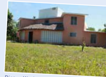
Dieses Kindergartengebäude wurde im Jahr 2009 erbaut.