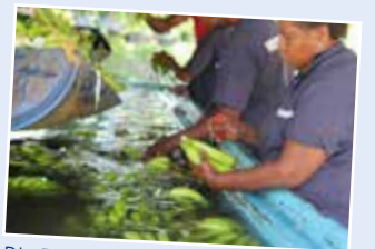
Die Bananen werden auf der Finca sorgfältig gesäubert, mit Labeln versehen und für die Schiffsreise verpackt.