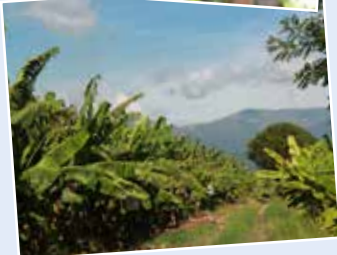
Ein Blick in die Bananen-Plantage.