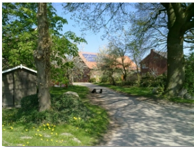
Seit 1996 betreibt die Familie ihren Hof nach Bioland-Richtlinien.