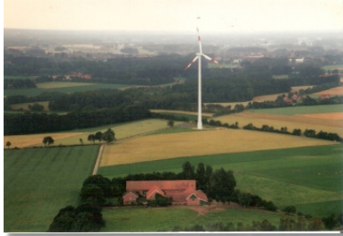
Der Bioland-Hof Wening in Gescher.